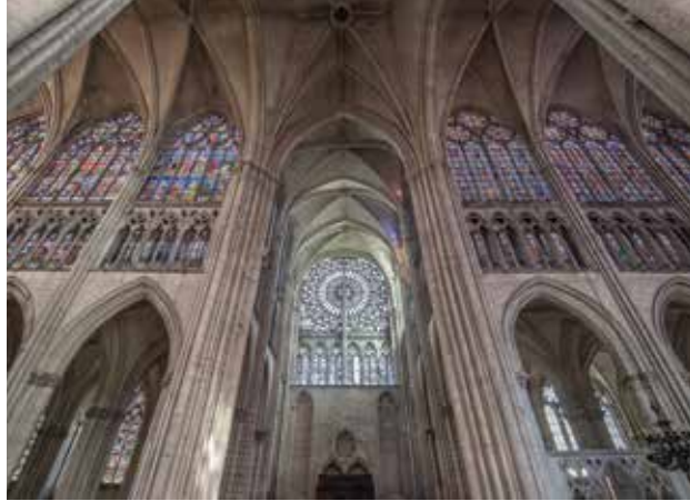
La cathédrale Saint-Pierre-et-Saint-Paul de Troyes