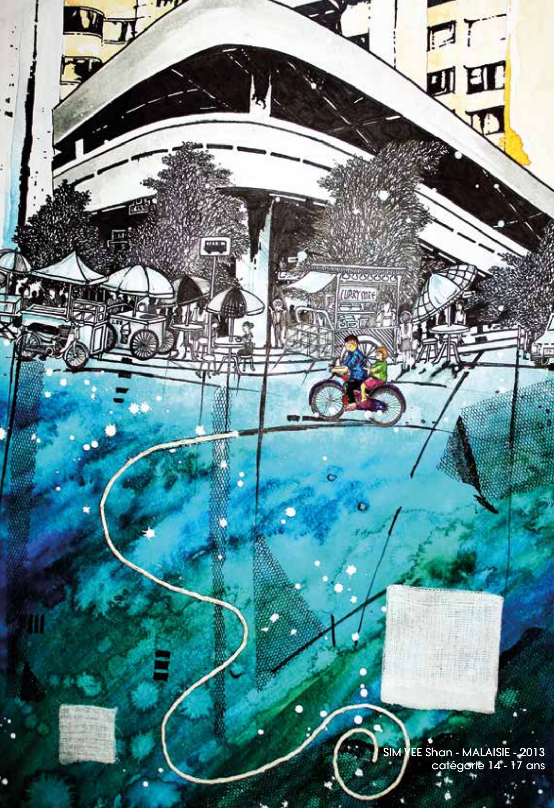
SIM YEE Shan - MALAISIE - 2013 catégorie 14 - 17 ans