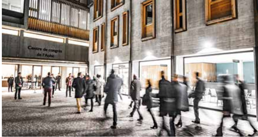
Le Centre de congrès de l'Aube