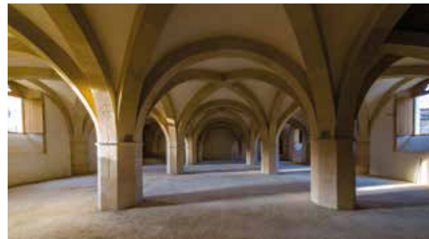
Le cellier des convers - Abbaye de Clairvaux