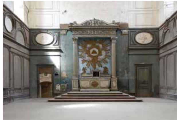
L'abbaye de Clairvaux - réfectoire - chapelle

Dans l'Aube en Champagne, vous pourrez découvrir l'abbaye de Clairvaux, haut-lieu de l'histoire religieuse et site imprégné de la spiritualité cistercienne, les caves de champagne et les vigneron passionnés, les paysages viticoles apaisants ou encore le musée du Cristal de Bayel, situé à côté de l'ancienne Cristallerie Royale de Champagne.