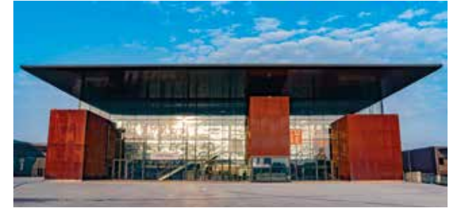
Le Cube Troyes Champagne Expo