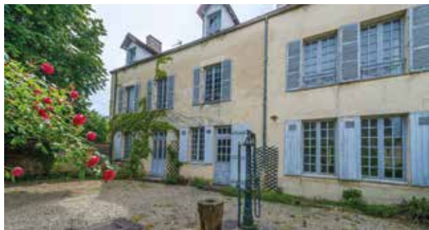
La maison des Renoir